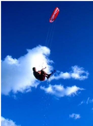
Kite Surfing 2

Kiten mit Rollerblades gibt es auch schon (statt dem Surfbrett nimmt man Rollerblades). Das normale, bekannte Inlineskaten ist auch wiedererwacht und erfreut sich gesteigerter Beliebtheit.