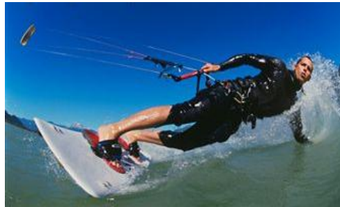
Kite surfing 1

Dann gibt es eine Fülle an Fortbewegungsarten, die entweder neu entdeckt werden, Abwandlungen von schon bestehenden oder eine Kombination von zwei Sportarten sind, die zuvor nichts miteinander zu tun hatten, wie das Kitesurfen , bei dem ein Surfbrett mit einem Lenkdrachen (Kite) kombiniert wird und dazwischen ist der Surfer, der Spaß und Freiheit genießen kann.